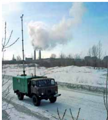
Рис. 1. Станция АКВ-2

При решении обратной задачи определения характеристик источников одновременно решаются несколько однотипных задач, поэтому целесообразно при таких условиях проведения численного моделирования привлечь высокопроизводительную вычислительную технику.