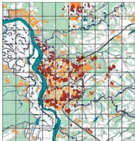
Рис. 2. Область исследования с нанесенной горизонтальной сеткой (• – источники примеси)

Численное решение обратной задачи переноса примеси с целью идентификации городских районов-загрязнителей осуществляется следующим образом: в качестве входных параметров используются данные измерений концентрации монооксида углерода, которые получены при помощи мобильной метеостанции АКВ-2 [2] (рис. 1). Область исследования имеет площадь размером 50×50 км, в ее центральной части находится городская территория (рис. 2).